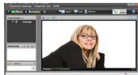
Istunnossa yksi osallistuja