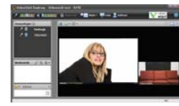
Istunnossa kaksi osallistujaa

Puhuessasi vihreä palkki liikkuu äänesi mukaisesti. Tarkista, että kuvasi näkyy ruudulla esimerkkien mukaisesti.